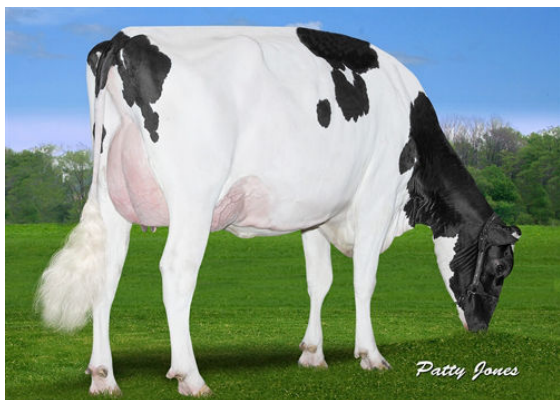
CLAYNOOK FABBY SILVER FOURTH DAM