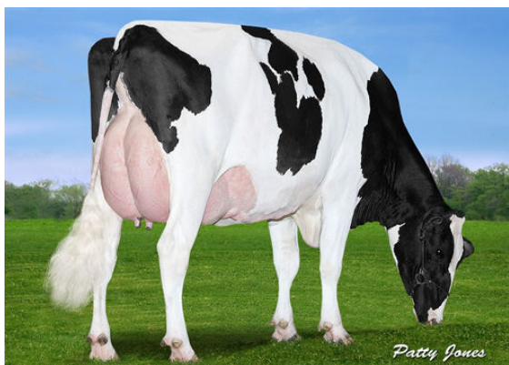
VIEW-HOME MCC FOUND FIFTH DAM